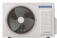
9 & 12k BTUS